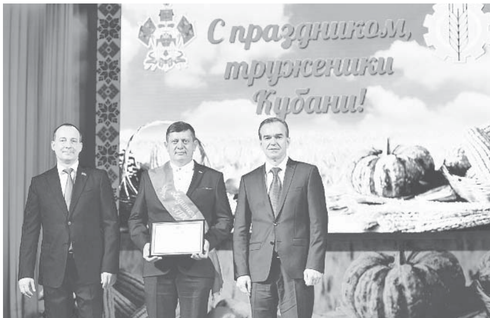
Вениамин Кондратьев на краевом празднике урожая подвел итоги уборки сельхозкультур

В этом году собрано восемь миллионов тонн пшеницы, почти 90 процентов — это продовольственное зерно. В этом большая заслуга ученых-селекционеров, подчеркнул