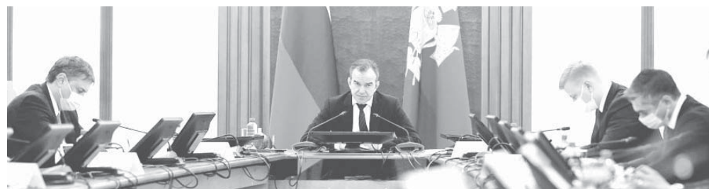
Вениамин Кондратьев провел расширенное планерное совещание по вопросам предупреждения ЧС

Глава администрации (губернатор) Краснодарского края Вениамин Кондратьев провел расширенное планерное совещание по вопросам предупреждения ЧС, связанных с непогодой на территории Краснодарского края.